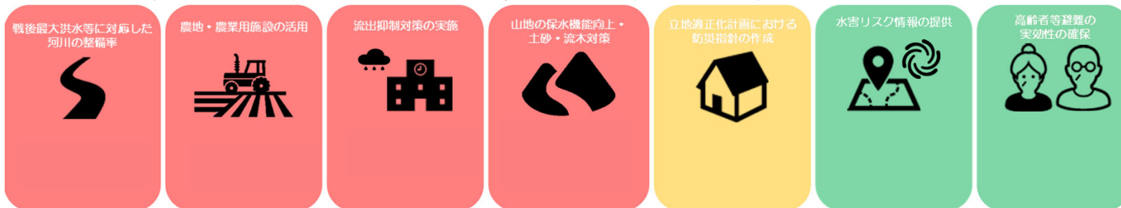
流域治水プロジェクトに関する主な指標