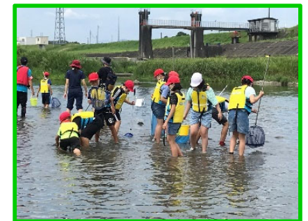
小中学校などにおける河川環境学習 (三重河川国道事務所、各市町)