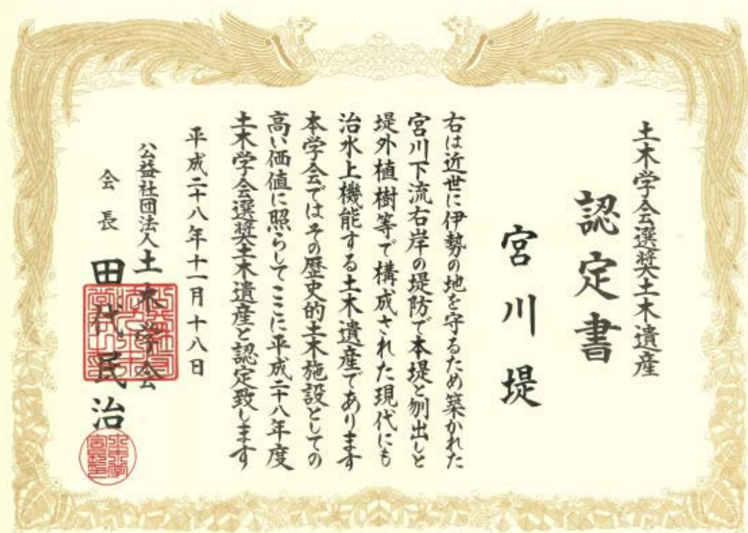
土木学会選奨土木遺産認定書