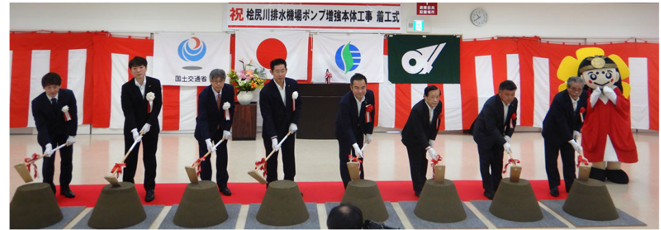
鍬入れ前の様子 伊勢市観光PRキャラクター「はなてらすちゃん」も登場