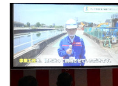
若手職員による現地リポート(映像)