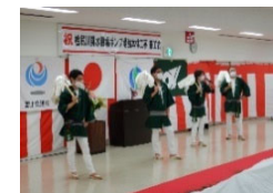
木遣り(きやりの)披露