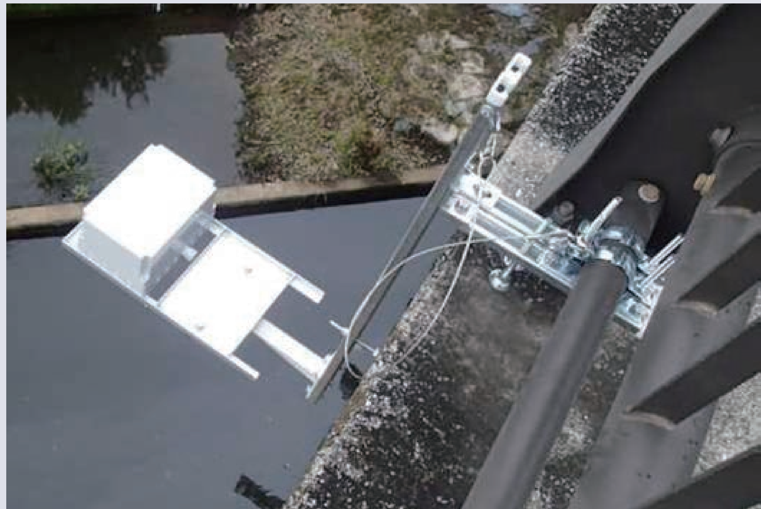
現場実証実験第一弾(鶴見川水系 鳥山川)