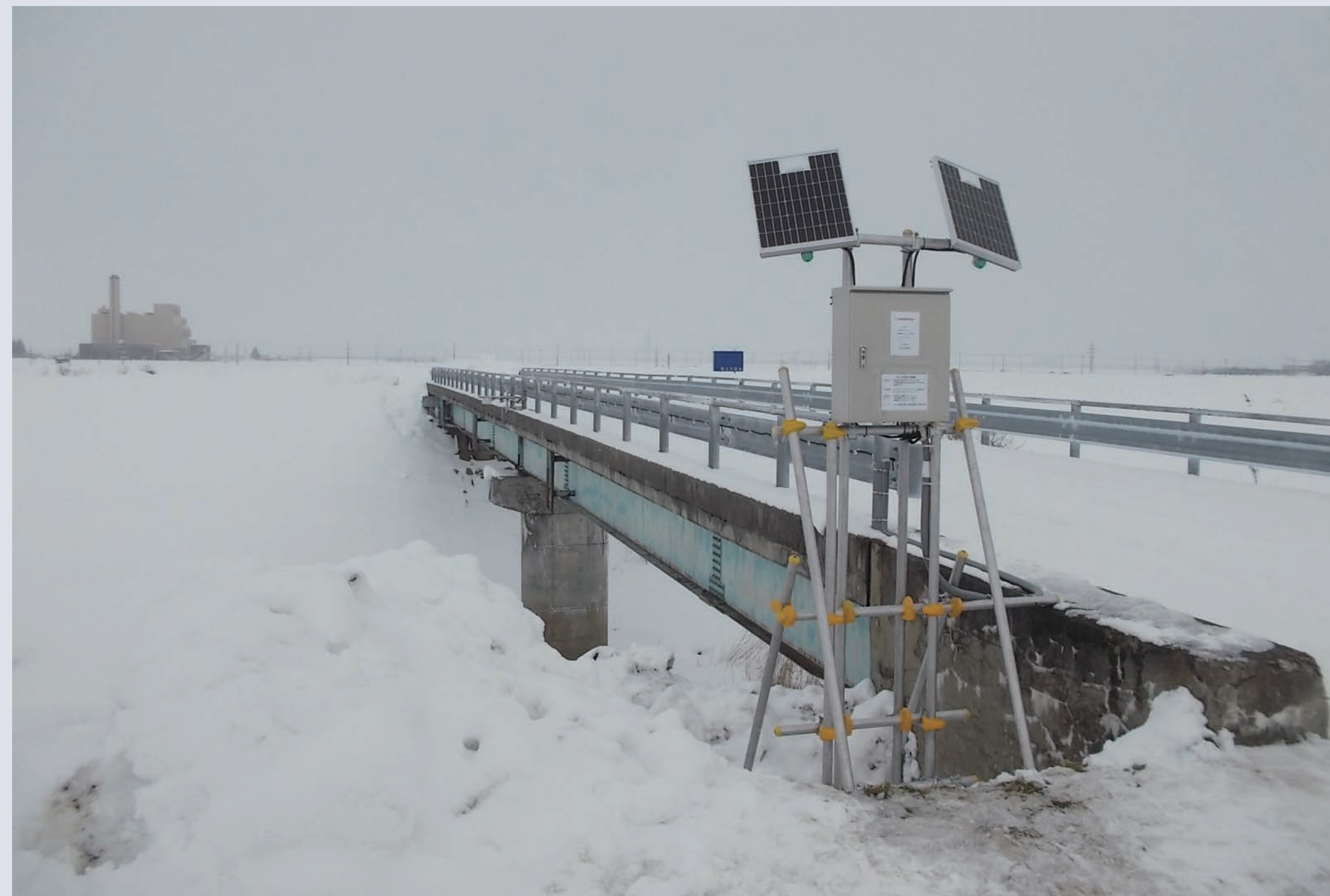
現場実証実験第二弾※寒冷地仕様(最上川水系)