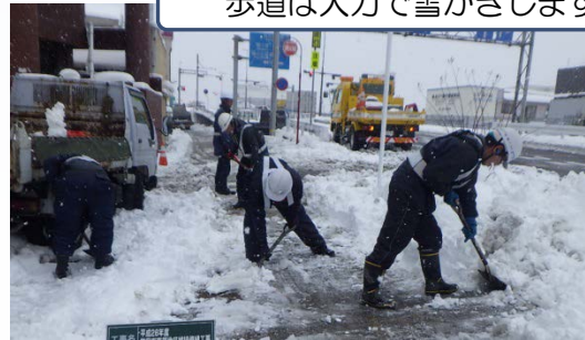
歩道は人力で雪かきします