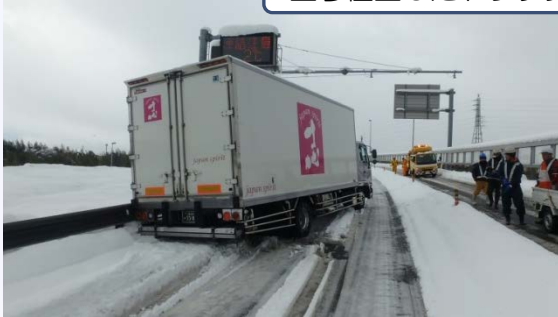
立ち往生したトラック