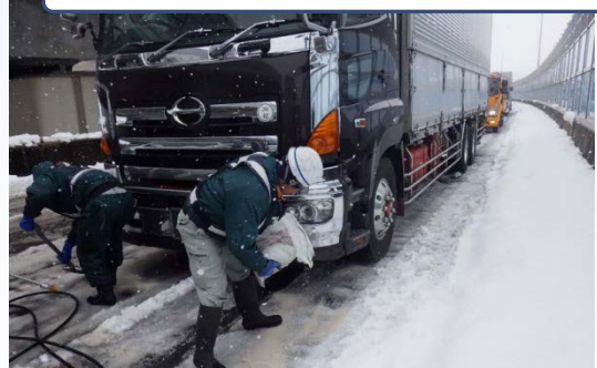
高圧洗浄機で雪をはじきとばします