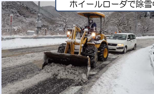
ホイールローダで除雪中