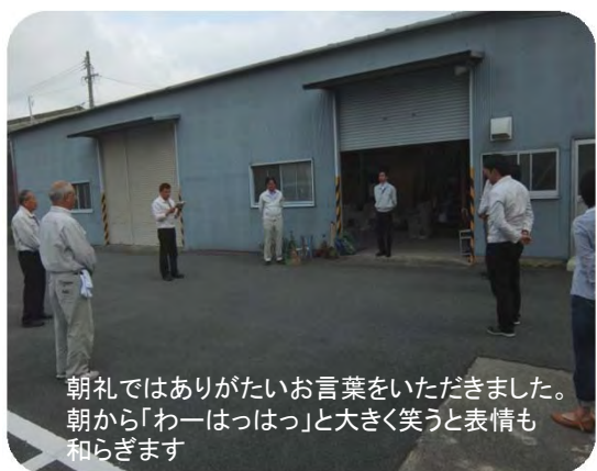
朝礼ではありがたいお言葉をいただきました。朝から「わーはっはっ」と大きく笑うと表情も和らぎます

国道1号沿い、四日市市小古曾の会社近辺で、平成2年から週2回行っています。なんでも先代の社長が社会貢献をしたいという一心で行ったこととか。ゴミ拾いだけでなく朝から笑顔満タンになる朝礼も参加させていただきました。