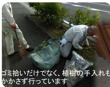
ゴミ拾いだけでなく、植樹の手入れもかかさず行っています