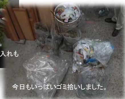
今日もいっぱいゴミ拾いました。

8月6日には道路ふれあい月間表彰式にて、事務所長表彰を授与されました。懇談会では20年以上もの間ボランティアで清掃されてきたノウハウを教えていただいたり、道路の植樹帯の手入れの話などで盛り上がりしました。