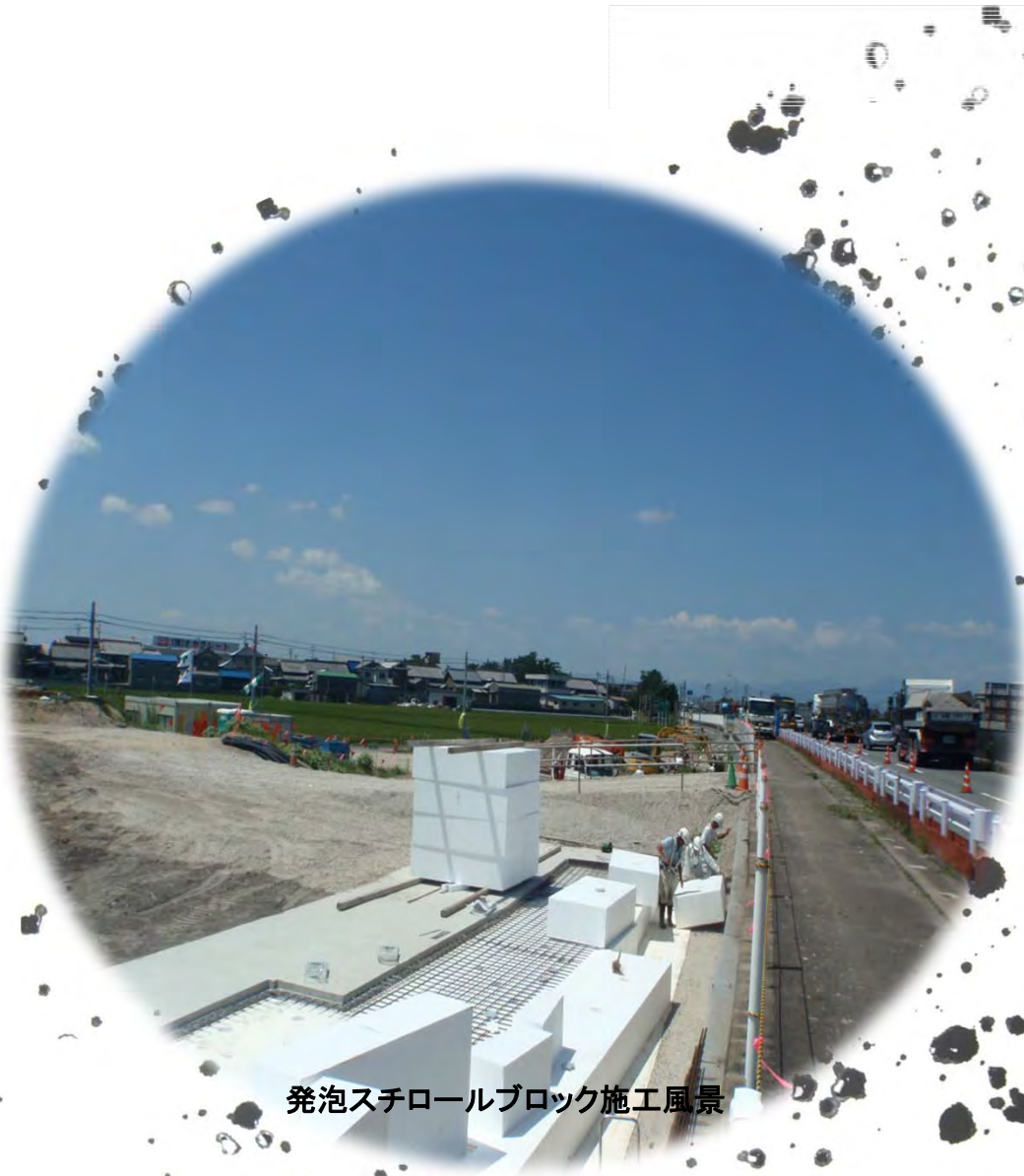
発泡スチロールブロック施工風景

桑名郡木曾岬町にて施工中の交差点工事の風景です。 国道23号に県道が取り付くため土を盛っていると思いきや、なんと、材料は発泡スチロール！ 形を整えてきれいに並べています。通常の土を盛る方法より早く出来上がるメリットがあります。 道路の横から巨大な発泡スチロールブロックが見えるシュールな風景でした。