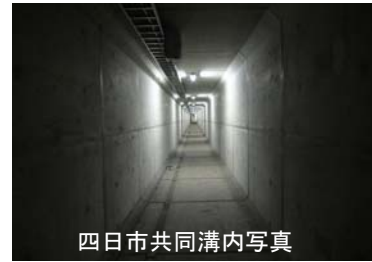
四日市共同溝内写真

一般公開はしていませんが、四日市市の街中にこんな空間があるということに驚きです。付近の中央分離帯には送風口が地表からひょっこり顔をのぞかしており、人間が創り出す大きい構造物に改めて感激しました。