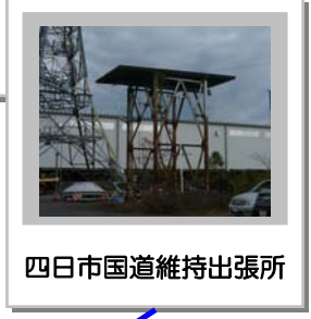
四日市国道維持出張所