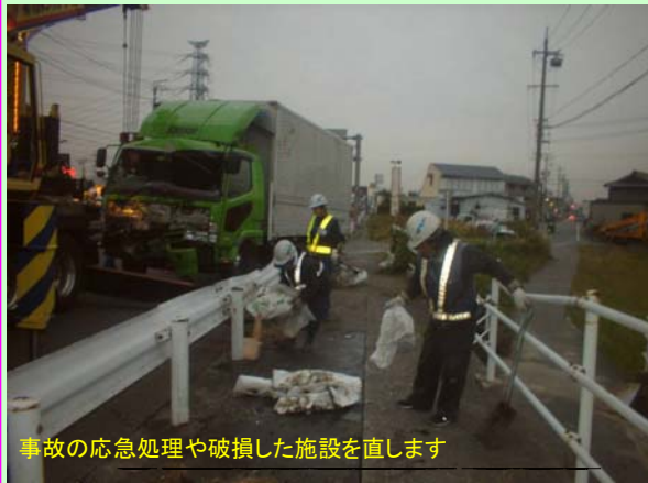
事故の応急処理や破損した施設を直します