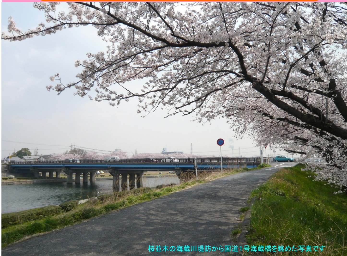
桜並木の海蔵川堤防から国道1号海蔵橋を眺めた写真です

※表紙の写真を募集しています。三重河川国道事務所までお送り下さい。メールアドレスは mie@cbr.mlit.go.jp TOPページ 上段「お問い合わせ」等へ