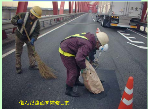
傷んだ路面を補修します