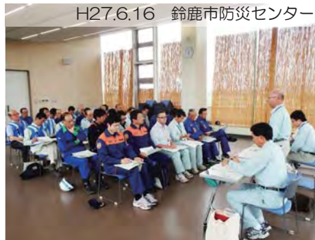
H27.6.16 鈴鹿市防災センター

各市の水防担当者、水防団のみなさんが集まり、増水時に危険となる箇所や、過去に被害のあった箇所を確認するとともに、現地を巡視しました。増水時は連携を取りながら対応します。