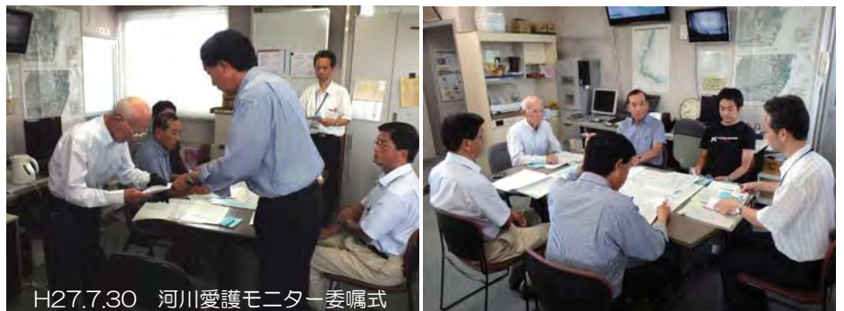
H27.7.30 河川愛護モニター委嘱式