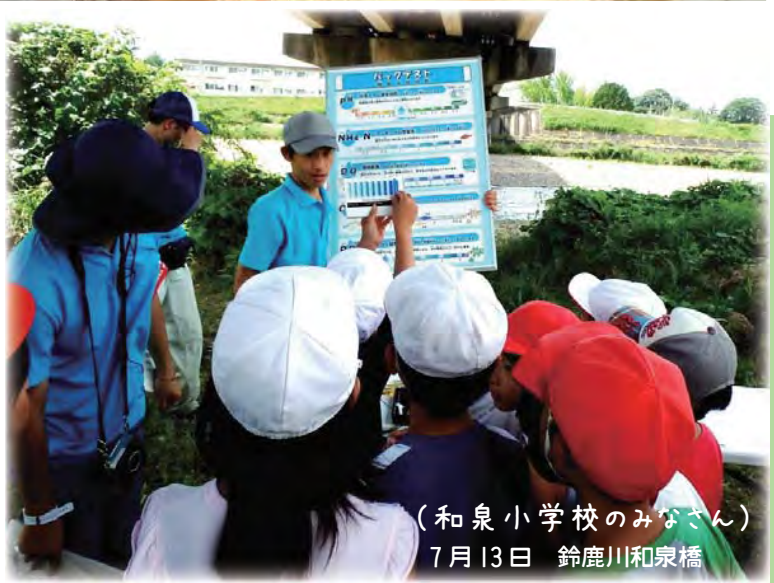
(和泉小学校のみなさん) 7月13日 鈴鹿川和泉橋