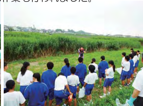
アレチウリ駆除の専門家による説明