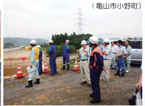
( 亀山市小野町 )