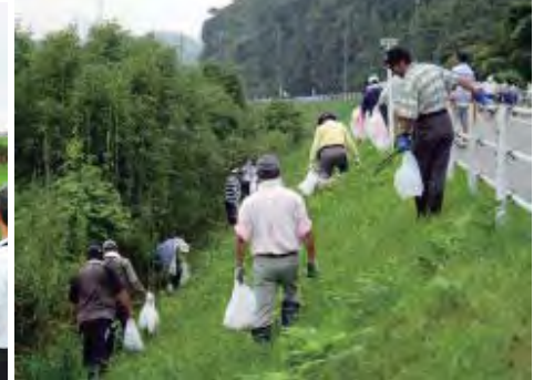
采女城跡入り口に向かう市道沿い（内部「かわらばん」2015年7月より引用）