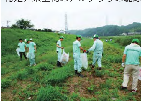
河川工事に携わる施工業者も参加しました。