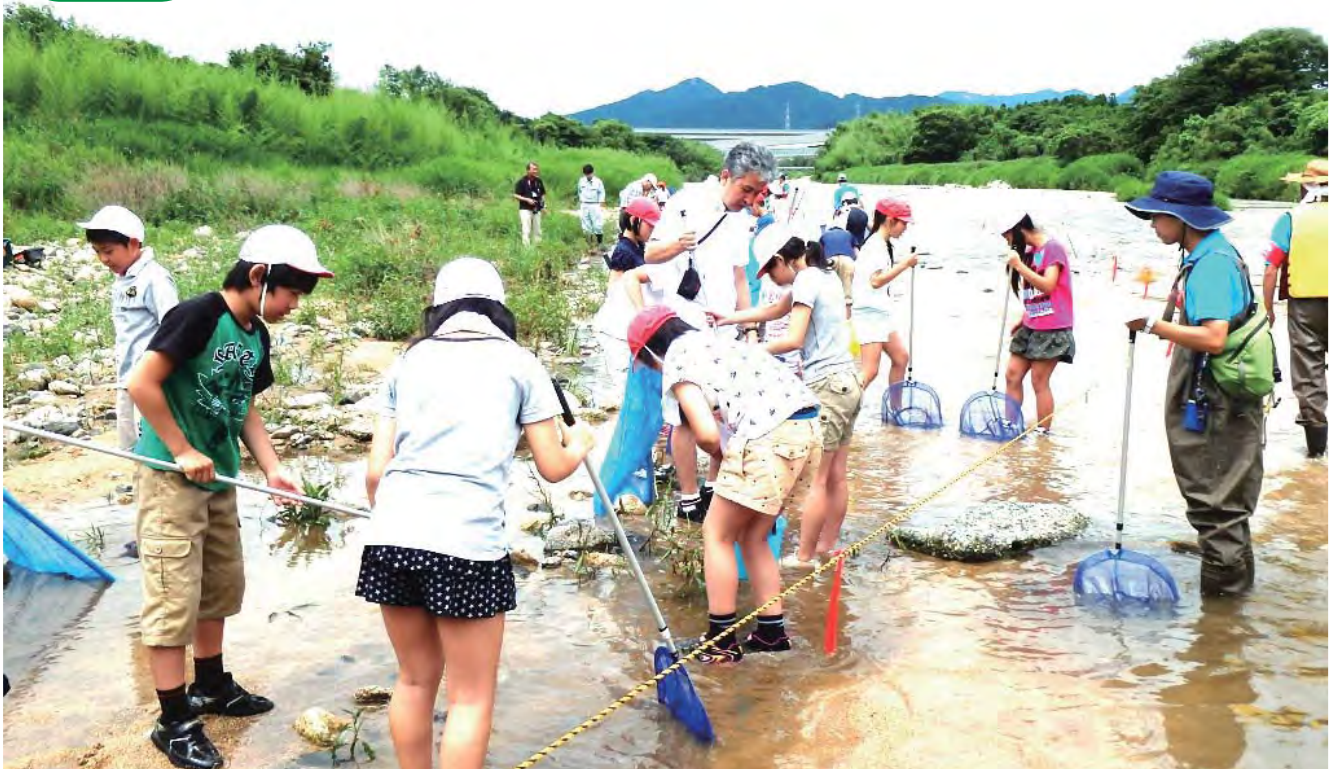
(神辺小学校のみなさん) 6月29日 鈴鹿川山下橋上流