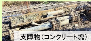
支障物(コンクリート塊)