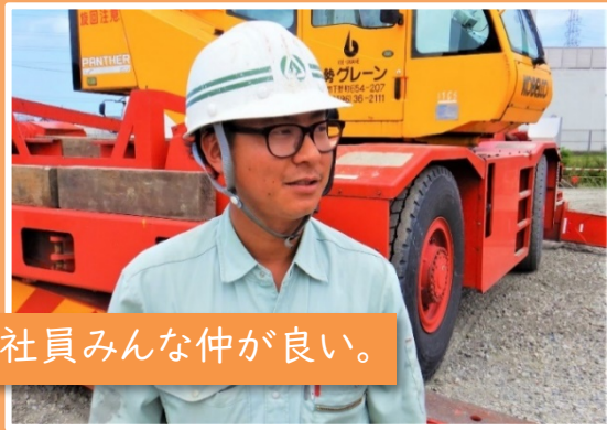
令和3年度 桧尻川樋門改築工事