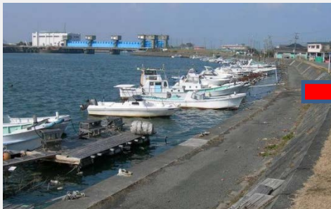
平成21年11月時点（一色町地先にて）