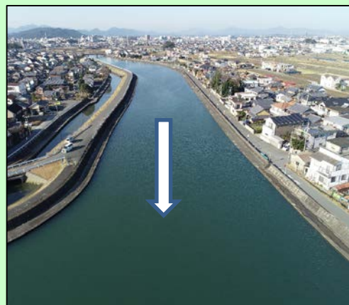
下流より上流を望む

皆様には工事中での ご協力をご感謝すると共に、引き続き「勢田川流域等浸水対策緊急プロジェクト」へのご理解ご協力の程よろしくお願い致します。