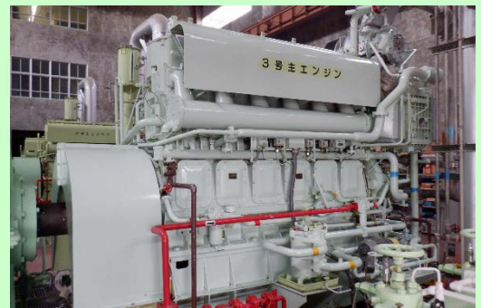
整備後の3号ポンプ用主原動機