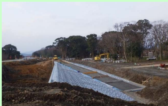
宮川右岸5.2k付近 下流より上流を望む