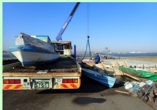
五十鈴川右岸2.6k付近 廃船処理状況

緊急的な維持工事にて近隣の皆様にご迷惑をお掛けする事もあるかと思いますが、完成まで安全第一で作業を進めてまいりますので、ご理解、ご協力の程よろしくお願いいたします。