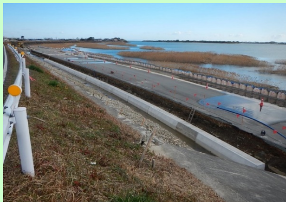
宮川左岸2.6k付近 上流より下流を望む