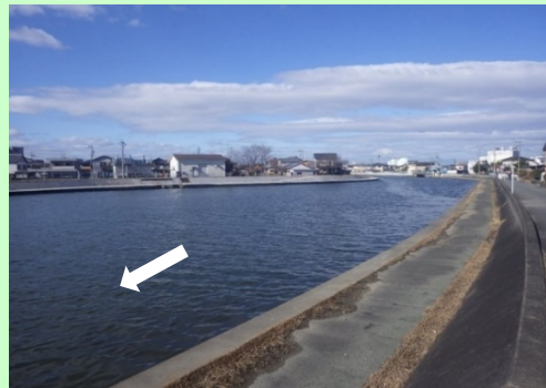
勢田川2.7k+150m付近 下流から上流を望む