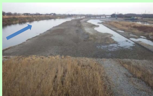
度会橋より下流を望む

地域の皆様には大変ご迷惑をお掛けしますがご理解とご協力のほどよろしくお願いいたします。