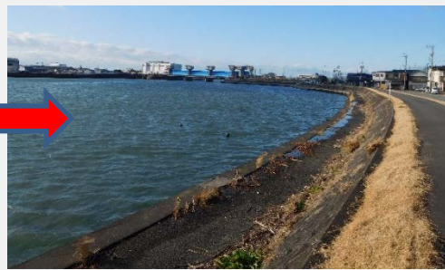
令和2年1月時点（一色町地先にて）