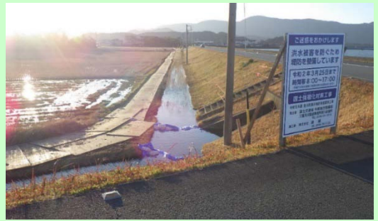
五十鈴川右岸2.2k付近 下流より上流を望む