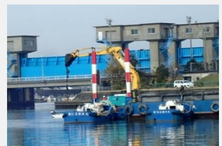
係留ブイの引き揚げ作業 令和元年12月