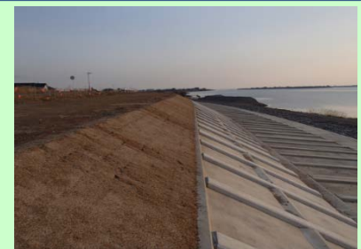
宮川左岸2.8k付近(川表工区)

洪水対策のための堤防補強工事を昨年3月から行っています。現在88%の進捗となり、令和2年3月の完成で工事を進めております。