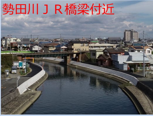
勢田川 JR 橋梁付近