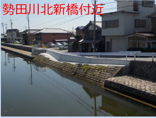
勢田川北新橋付近