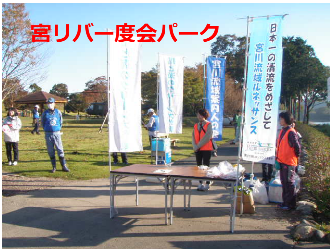
宮リバー一度会パーク