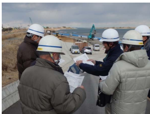
西豊浜の工事現場にて。