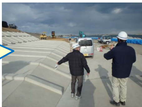
堤防の構造について質問するモニターさん