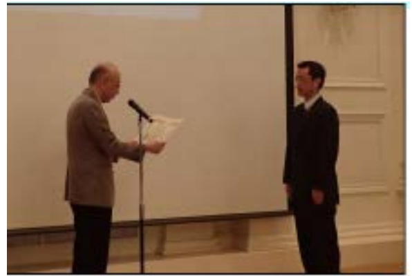
認定書授与式の状況