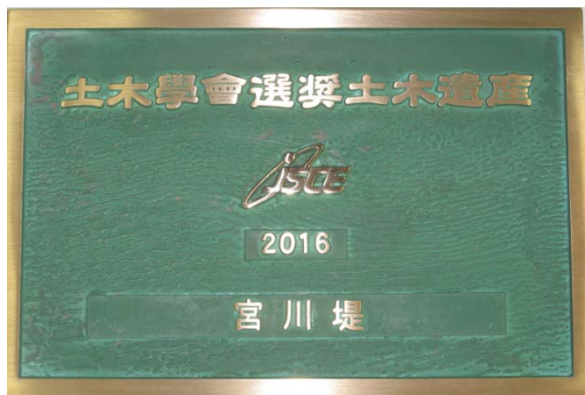
土木学会選奨土木遺産プレート