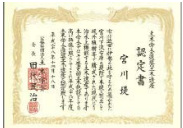
土木学会選奨土木遺産 認定書