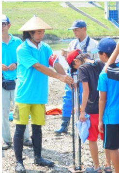
↑ 透明度を測って川の水のきれいさを調べています。