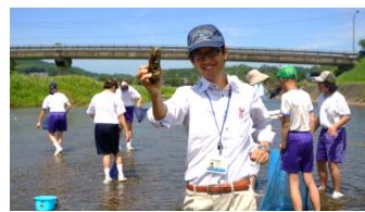
↑ 水生生物を見つけました！