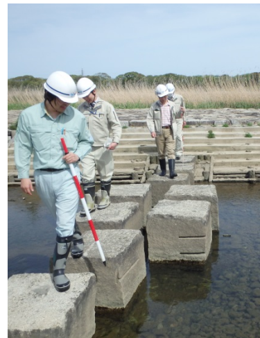
宮川親水公園での点検風景