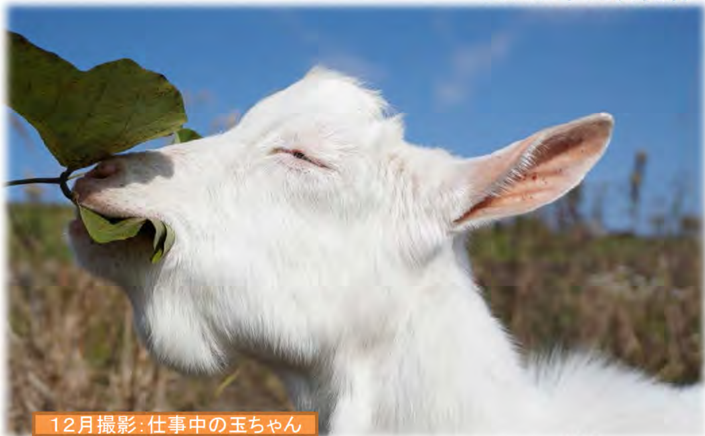
12月撮影:仕事中の玉ちゃん

11/27～12/26の間、玉城町昼田地区において「水辺の楽校」事業によるヤギの実験飼育を行っています。これは例年行われている除草を機械に代わってヤギに食べてもらうという実験です。