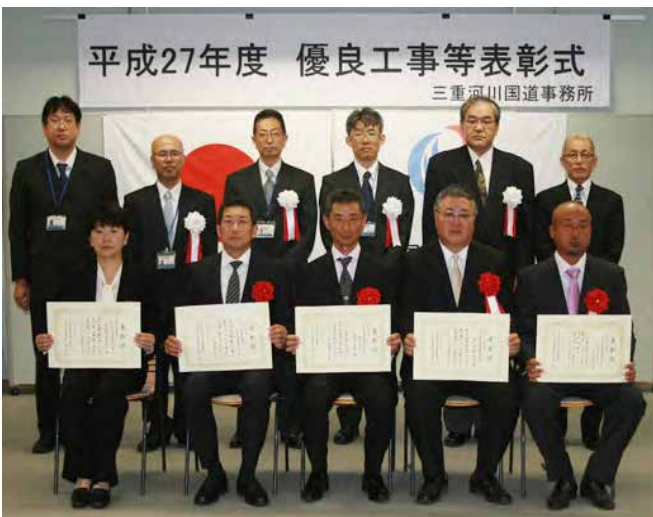
宮本建設(株)と(株)森下建設と森田造園(有)