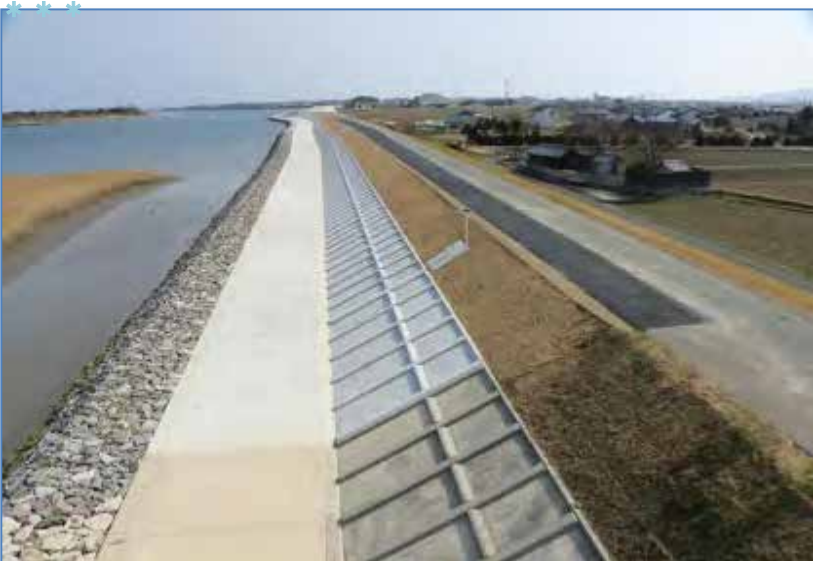
H26宮川上條堤防護岸工事