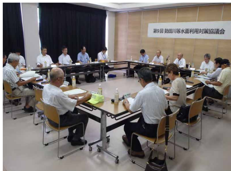
第9回 勢田川等水面利用対策協議会

今後は、「船舶を係留する場所を今後増やす方策」と、「係留することのできない船舶を減らしていくための方策」の両方を進めていくことで、目標としている平成31年度までの問題解決に向けて取り組んでいきます。