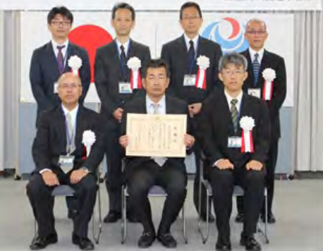
平成27年度 河川愛護月間表彰式 三重河川国道事務所

この功績が認められ、中部地方整備局長からの感謝状が三重河川国道事務所の事務所長よりへ手渡されました。