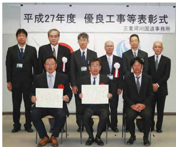
朝日丸建設(株)と(株)北嘉組