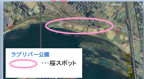
ラブリバー公園 …桜スポット