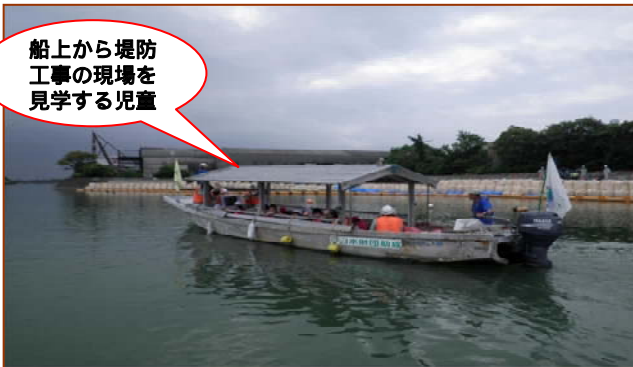
船上から堤防 工事の現場を 見学する児童