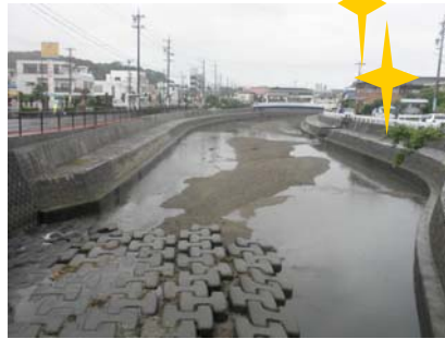
1時間後・・・綺麗な勢田川に！！