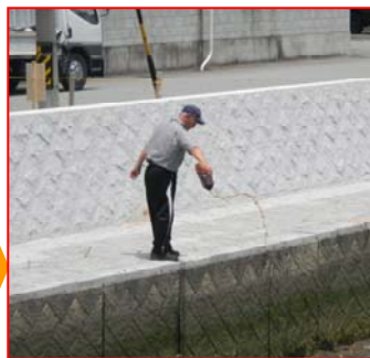
効果アップのため活性液をまきました