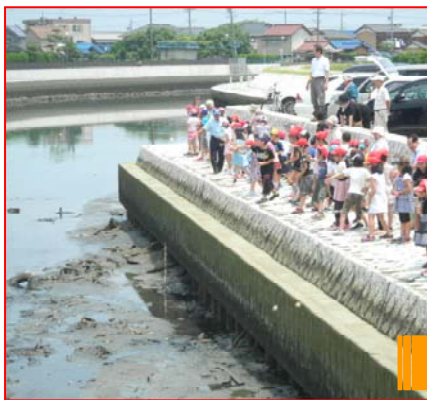
児童達が元気に投げ込んでいます！