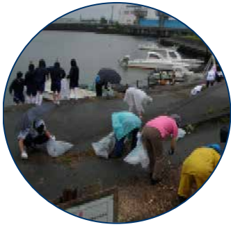
一色町での清掃風景

今年で17回目を迎える「勢田川七夕大そうじ」が平成24年7月1日に実施されました。伊勢市の50%の生活排水が流され、水質汚染や河川敷のゴミが深刻な問題になっている勢田川ですが、昔のように人々に親しみのある綺麗な勢田川にとの願いを込めて、毎年七夕に近い日曜日に開催されています。当日はあいにくの雨にもかかわらず、2500名もの市民が集まり勢田川をはじめ支流の朝川、松尻川の計11キロを約1時間をかけて、ゴミ拾いや草刈りなどを行いました。