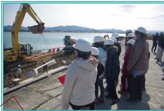
真剣な様子で工事の説明を聞く児童達