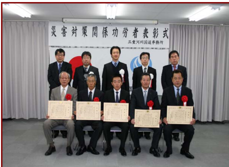
表彰式の様子。下段はそれぞれの企業の代表者の方々。