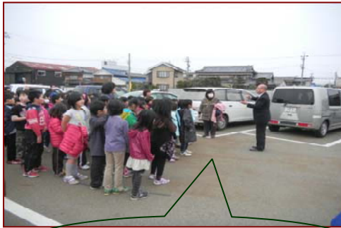
有緝小学校の児童たち。EM団子投入についての説明を聞いています。