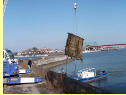
〈船舶等の強制撤去の様子〉

また、今回、簡易代執行で撤去を行った箇所を中心に 重点撤去区域 を設定し、勢田川等の不法船舶対策を進めていきます。