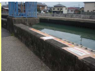
(重点的撤去区域を設定した区域：左岸3.6k)