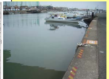
(重点的撤去区域を設定した区域：右岸0.4k)