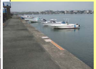
(重点的撤去区域を設定した区域：右岸1.2k)