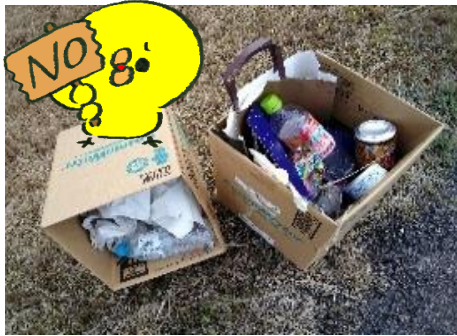
家庭ごみ例（飲食ごみ）