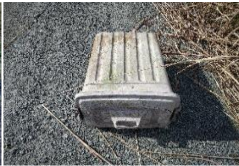
粗大ごみ例（ポリバケツ）