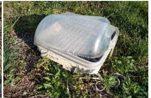
家電ごみ例（食器乾燥機）