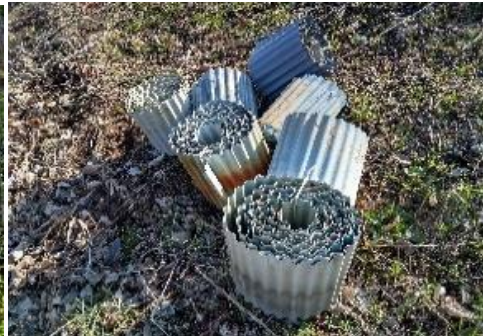
産業廃棄ごみ例 （畦波シート）