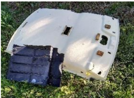
廃車機械ごみ例（部品）