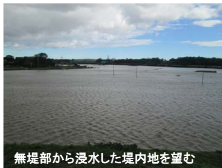
無堤部から浸水した堤内地を望む

また雲出川の基準地点である雲出橋の水位をはじめ、中村川、波瀬川でも、はん濫危険水位を超える出水となり、中流部の無堤地区で農地の浸水被害などが発生しています。