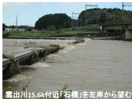
雲出川15.6k付近「石橋」を左岸から望む