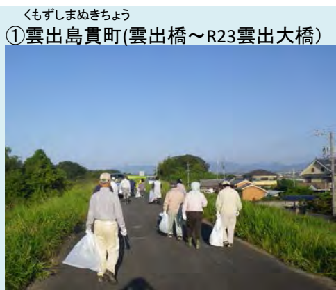
実施日: 9月28日(日) 参加者: 90名