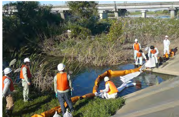
オイルフェンス展張訓練

雲出川出張所の紹介/ご意見、ご感想等ありましたら、雲出川出張所までお寄せください！