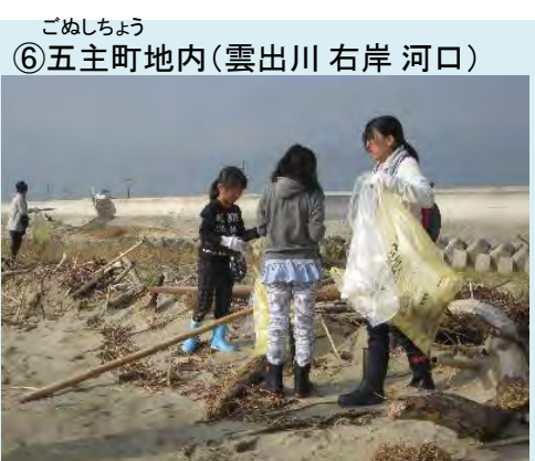
実施日: 10月25日(土) 参加者: 135名