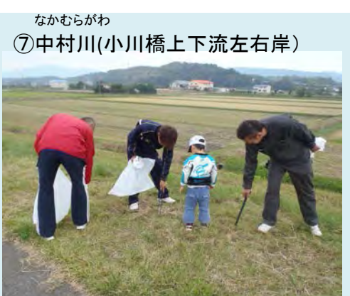
実施日: 10月26日(日) 参加者: 138名