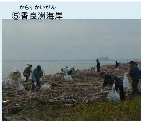
実施日: 10月26日(日) 参加者: 107名