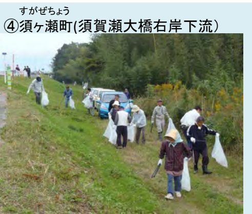
実施日: 10月26日(日) 参加者: 51名