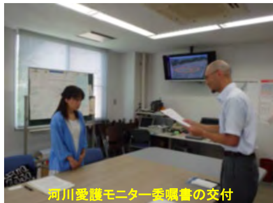
河川愛護モニター委嘱書の交付