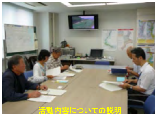
活動内容についての説明

モニターでない皆様も、河川を利用する際に気づいた事等があれば、雲出川出張所までお知らせ下さい。