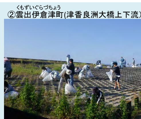
実施日: 9月28日(日) 参加者: 70名