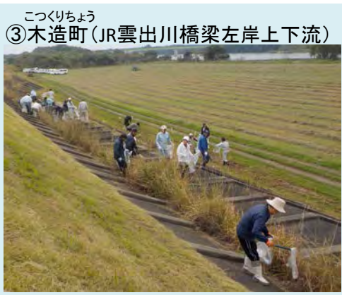
実施日: 10月26日(日) 参加者: 43名