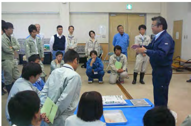
油類吸着処理の説明

当日は、三重四水系水質保全連絡協議会の構成員（国、水機構、県及び7市町）から水質保全の担当者約50名が訓練に参加し、油類吸着処理の説明を受け、オイルフェンス展張訓練や水質分析訓練等を行いました。