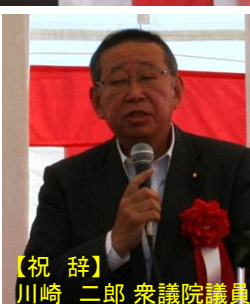
【祝 辞】 川崎 二郎 衆議院議員