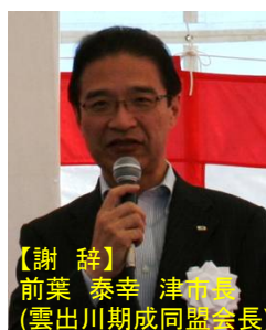
【謝 辞】 前葉 泰幸 津市長 (雲出川期成同盟会長)