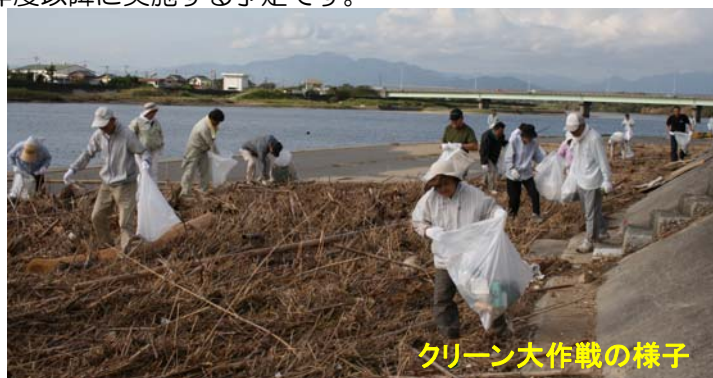
クリーン大作戦の様子