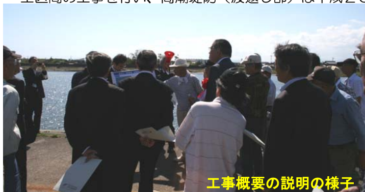
工事概要の説明の様子

工事は雲出古川左岸の河口部から延長1240mのうち、延長800mの耐震対策と、一部区間で高水敷が未施工区間の工事を行い、高潮堤防（波返し部）は平成26年度以降に実施する予定です。