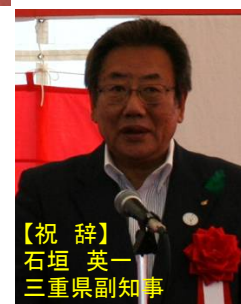
【祝 辞】 石垣 英一 三重県副知事