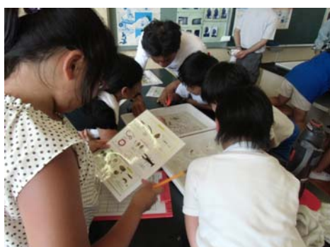
7月11日 大井小学校26名 雲出川