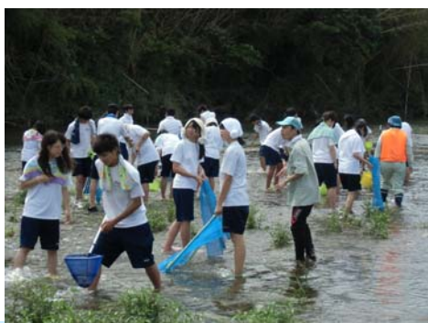
7月2日 久居中学校(3年2組)34名 雲出川