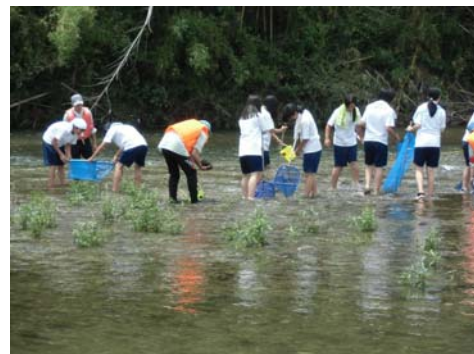
7月2日 久居中学校(3年4組)34名 雲出川

みなさまが家庭でちょっとした心がけや工夫をすることにより、汚れを大きく減らすことが出来ますので、ご協力をお願いします。