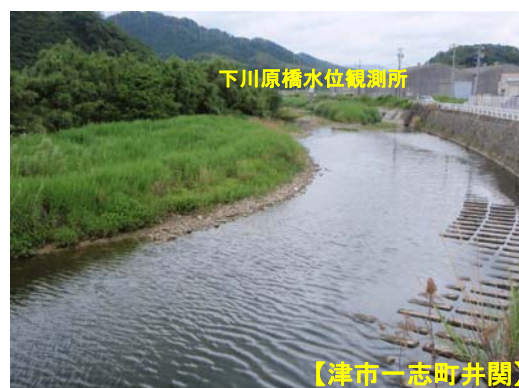
下川原橋水位観測所