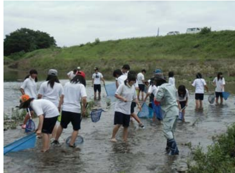
7月3日 久居中学校(3年5組)32名 雲出川