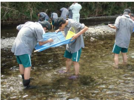
7月22日 久居農林高等学校 26名 雲出川