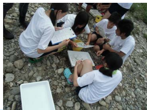
7月3日 久居中学校(3年3組)32名 雲出川

『水生生物調査』とは、河川に生息している様々な水生生物を調べ、河川の水質の状況を簡易的に判定するもので、川に親しみを持ち、川の環境に対する関心を深めることを目的としています。