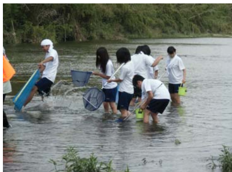
7月2日 久居中学校(3年1組)35名 雲出川