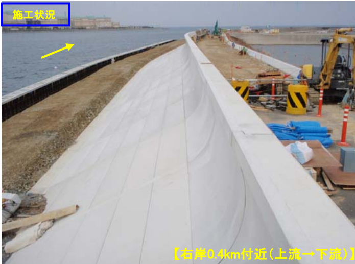
【右岸0.4km付近(上流→下流)】