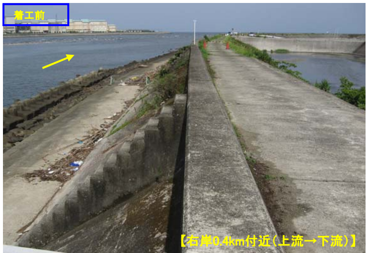
【右岸0.4km付近(上流→下流)】