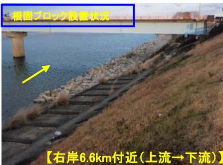
【右岸6.6km付近(上流→下流)】