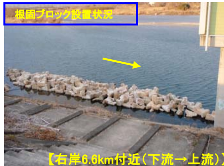
【右岸6.6km付近(下流→上流)】

伊勢湾台風により、甚大な被害が発生したことを受け、高潮堤防が整備されましたが、築後約50年が経過し、老朽化が進行しています。