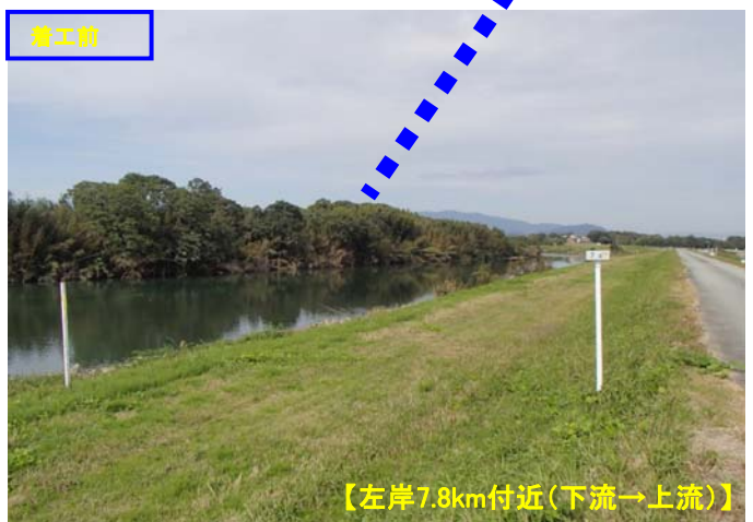
【左岸7.8km付近(下流→上流)】

11月から3月にかけて洪水時の水位を低下させるため、「樹木伐採」及び「河道掘削」を実施しました。【位置図⑦】 対岸が見渡せるようになり、景色も大きく変わったかと思えます。また、伐採木は小切りにして無料配布しました。 土砂は10tトラック(5m 3 )で約10,000台分(50,000m 3 )を運搬しました。