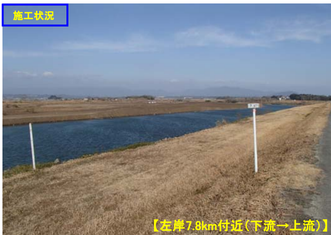
【左岸7.8km付近(下流→上流)】