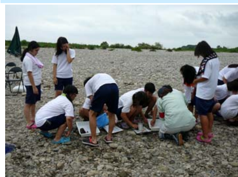
7月11日 久居中学校(3年2組)35名 雲出川