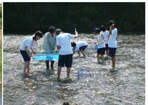
7月10日 久居中学校(3年1組)31名 雲出川