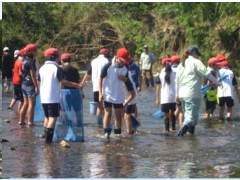
7月17日 桃園小学校65名 雲出川