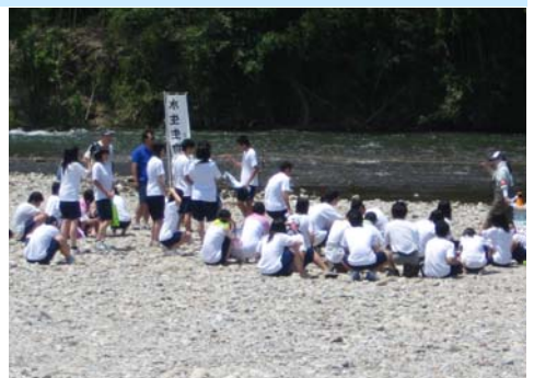
7月10日 久居中学校(3年4組)36名 雲出川