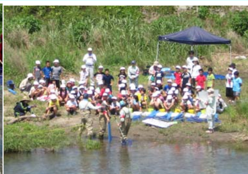
7月10日 栗葉小学校(B・C組)72名 長野川