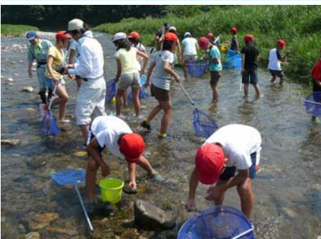
7月10日 栗葉小学校(A組)37名 長野川