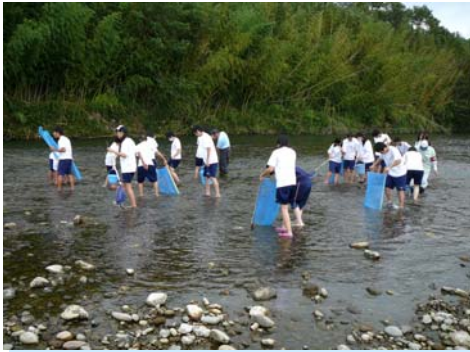
7月11日 久居中学校(3年5組)36名 雲出川