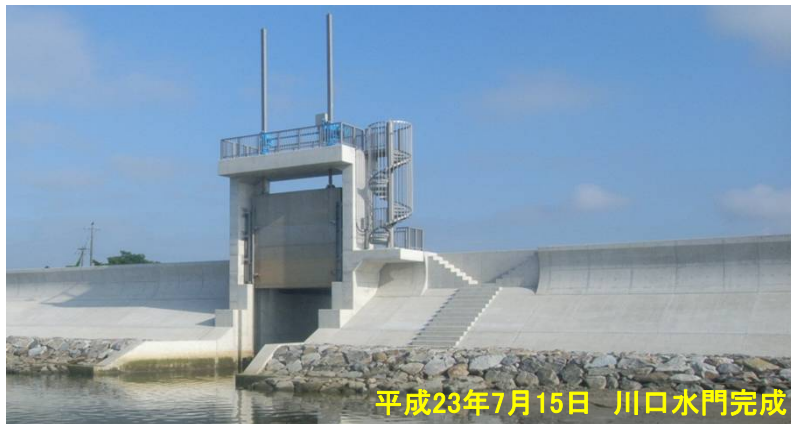
平成23年7月15日 川口水門完成

平成24年7月23日に「平成21年度 雲出川川口水門工事」を施工した(株)土生組の協力会社のうち3社〔(有)小林組、(有)辻本組、前橋建設(株)〕が三重河川国道事務所で表彰されました。旧川口水門は、昭和37年に建設。47年が経過し、老朽化が進行。耐久性(耐用年数)が限界状態にあるとして、平成21年5月に改築工事を着工。平成23年7月15日に完成し、国土交通省から津市へ引き渡されています。