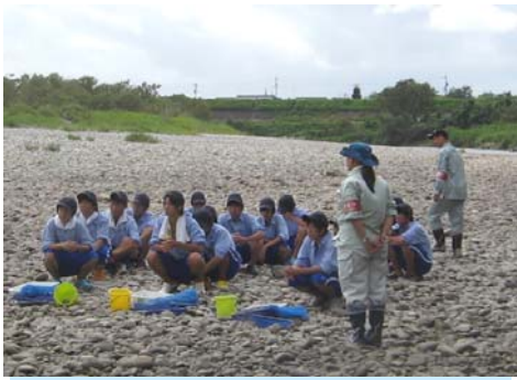
8月1日 久居農林高等学校 20名 雲出川

『水生生物調査』とは、河川に生息している様々な水生生物を調べ、河川の水質の状況を簡易的に判定するもので、川に親しみをもち、川の環境に対する関心を深めることを目的としています。調査では、きれいな川に住んでいる生き物をたくさん発見することができました。きれいな川を守るためには、よごれた水を流さないことや、川の周りにゴミを捨てないことが大切です。みなさまが家庭でちょっとした心がけや工夫をすることにより、汚れを大きく減らすことが出来ますので、ご協力をお願いします。