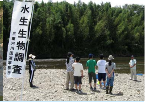
7月19日 フリースクール三重シュール 7名 雲出川