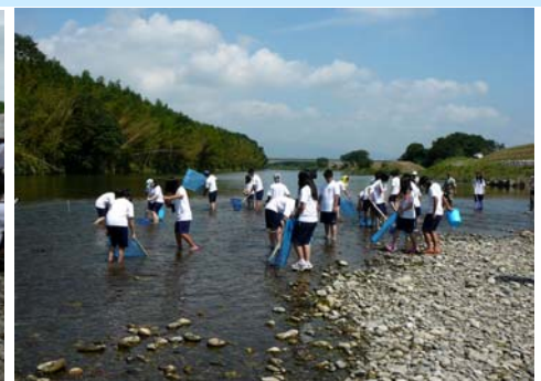
7月10日 久居中学校(3年3組)34名 雲出川