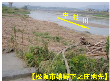
【松阪市嬉野下之庄地先】