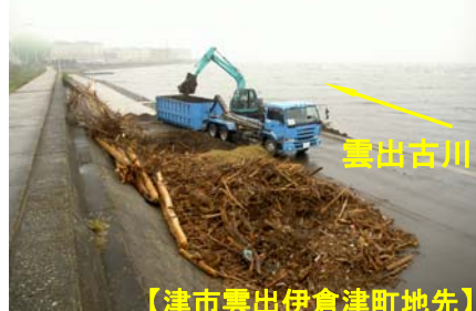
【津市雲出伊倉津町地先】