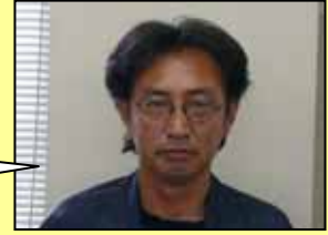
監理技術者・現場代理人