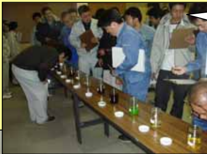
臭いと色で油を判別している様子

平成20年11月19日(水)に松阪嬉野町中川コミュニティーセンター(屋内会場), 中村川天花寺橋(屋外会場)において、水質事故対策訓練が開催されました。当日は河川やダム管理に関わる国・県・市町の職員等が集まり、水質事故発生時に迅速な対応ができるよう訓練を行いました。雲出川出張所では、今後も水質事故を発見次第、早急な対応に努めて参ります。もし川で油漏れや魚の大量死等の異常を発見された場合は、ご連絡をお願い致します。