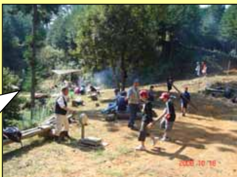
間伐材重さ測定ゲームの様子

森林環境保全の会・保護者の皆さんと森林の保全の大切さを学び、桧の間伐、紙芝居、ゲーム等で交流を深めました。また雲出川出張所から川の主な施設の紹介、流域のくらしや産業の話がされました。