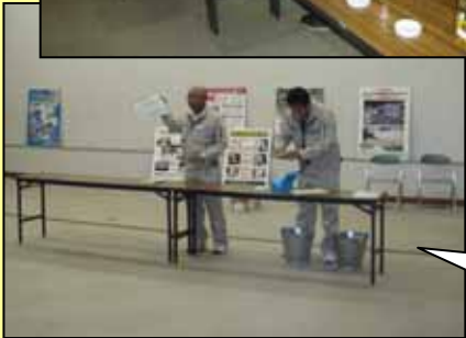
昨年度にはなかった簡易水質試験の説明