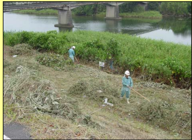
除草作業を行い、堤防に異常がないかを早期に発見します。