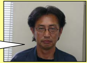
監理技術者・現場代理人