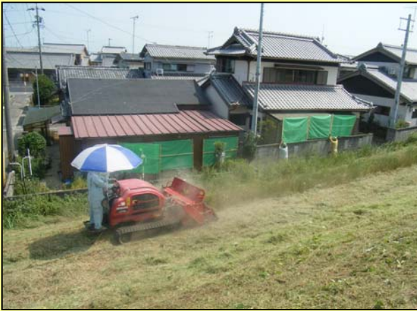
民家の近くは、飛石等に注意して作業しています。