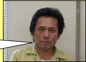
監理技術者・現場代理人