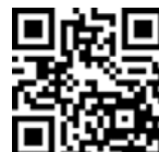
携帯電話用QRコード

雲出川、雲出古川、中村川、波瀬川についてのご意見、ご要望等ありましたら、雲出川出張所までお寄せ下さい。