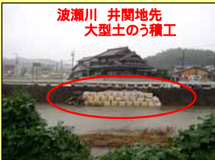
波瀬川 井関地先 大型土のう積工

出水期を向かえ、各水防団では下記表の通り、水防工法の演習、施設の巡視等を実施し、洪水から地域を守るために演習を行います。