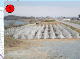
櫛田川右岸6. 2k+100付近 (松阪市高木町地先) 2,575m 3 (土砂) 十字ブロック1.0t 30個 三基ブロック2t 24個 根固ブロック2t 350個 根固ブロック(シエックブロック)2t 45個