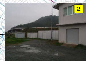
水防倉庫 (松阪市山添町地先) 櫛田川可動堰操作室構内