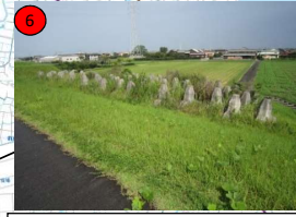
櫛田川右岸8. 8k+17付近 (松阪市法田町地先) 271m 3 (土砂)、根固ブロック(シエックブロック) 2t 84個