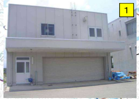
水防倉庫 (松阪市豊原町地先) 櫛田川出張所構内