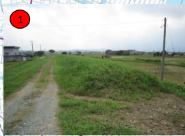
櫛田川左岸4. 2k+100付近 (松阪市西黒部町地先) 818m 3 (土砂)