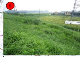
佐奈川左岸0. 6k-19. 7付近 (多気町池上地先) 436m 3 (土砂)