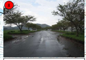
佐奈川右岸0. 0k付近 〔桜づつみ〕 (多気町朝長地先) 59,470m 3 (土砂)