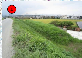
櫛田川左岸7. 4k+100付近 (松阪市櫛田町地先) 534m 3 (土砂)