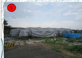
櫛田川左岸8. 2k+50付近 (松阪市豊原地先) 袋詰玉石 2t 3袋