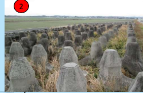
櫛田川右岸5. 8k+100付近 (松阪市高木町地先) 700m 3 (碎石) 十字ブロック2t 29個 三基ブロック2t 25個 根固ブロック2t 70個 根固ブロック(シエックブロック)2t 150個