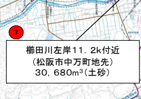
櫛田川左岸11. 2k付近 (松阪市中万町地先) 30,680m 3 (土砂)