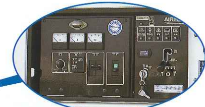
発動発電機操作パネル