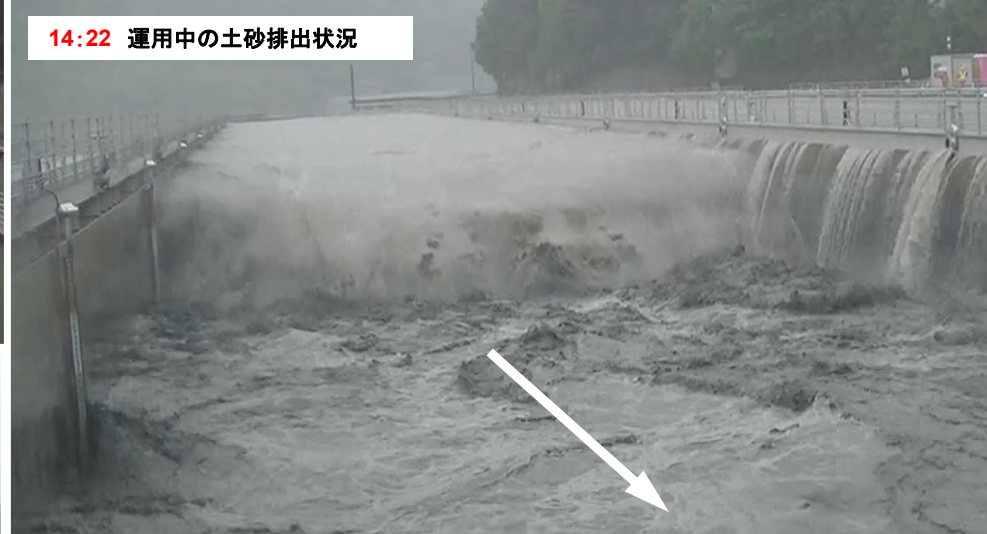
14:22 運用中の土砂排出状況