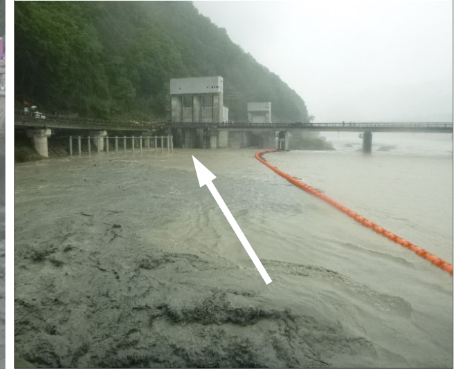
Stockヤード試験運用前(13:05)

Stockヤードから排出された土砂が土砂バイパストンネルに向かって流れている様子