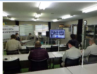
オンライン開催状況