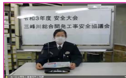
伊那警察署による講演