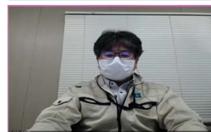
整備工事 池田建設(株)