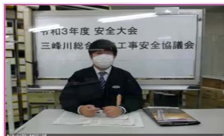
伊那労働基準監督署による講演