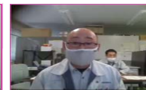
工事監督支援 技建開発(株)