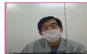
機械設備保守 (株)施設技術研究所