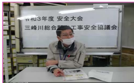
事務所からの情報提供