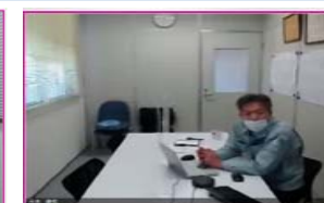
環境影響調査 (株)環境アセスメントセンター