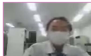
電気通信保守 松米電子工業(株)