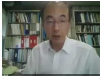
委員長挨拶（WEB会議画面）

について、事務局より説明し、委員からご意見・ご助言を頂きました。引き続きストックヤードの試験運用、モニタリング調査を進めます。