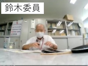
WEB会議状況（WEB会議画面）