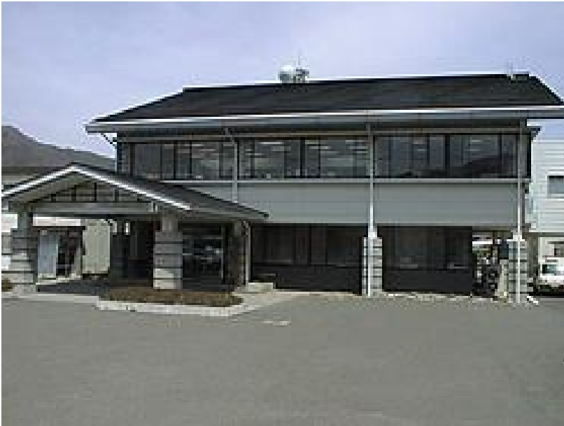
三峰川総合開発工事事務所