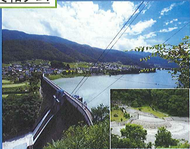
美和発電所とバイパストンネルも見学