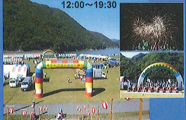
花火大会などの催し予定!!