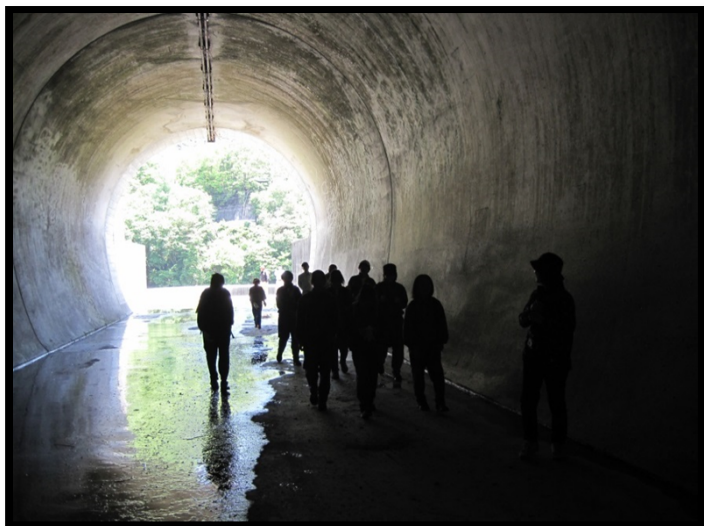
土砂バイパストンネル吐口