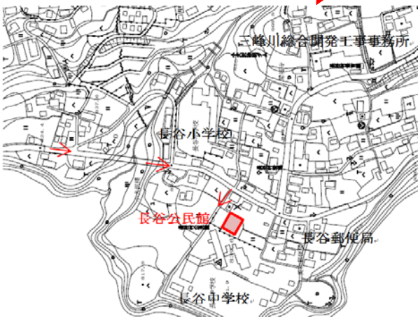
会議・講演場所：長谷公民館