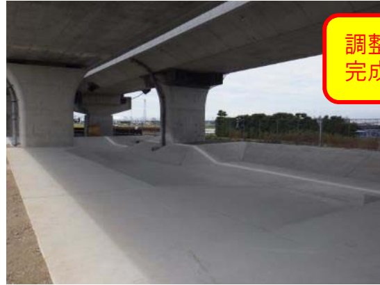
起点側より終点を望む