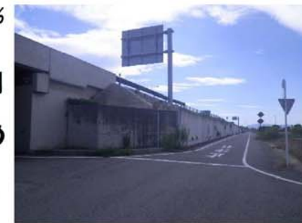
起点から藤井ICを望む 9/20通行止め予定

9月12日より路肩規制で準備工(草刈、舗装切断)を行い、9月20日から藤井ICより名古屋側の側道通行止めを行い本体工事に着手します。10月上旬から藤井ICより豊橋側の側道通行止めを行う予定です。通行止め期間については、現地に看板等で案内いたします。皆様には、しばらくの間、ご不便をお掛けしますが、ご理解、ご協力をお願い致します。