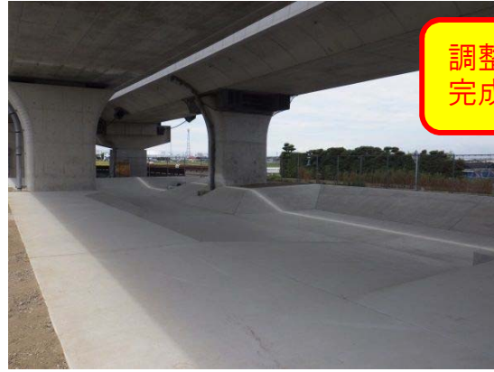
起点側より終点を望む