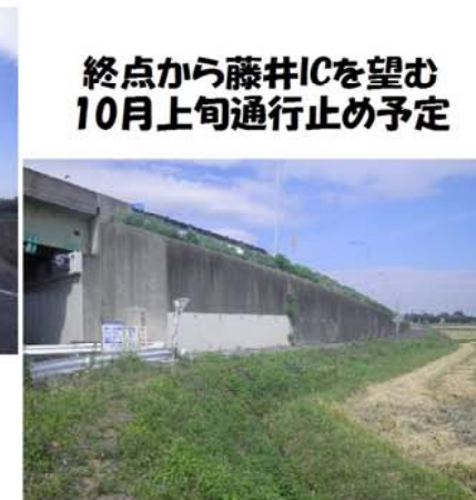
終点から藤井ICを望む 10月上旬通行止め予定