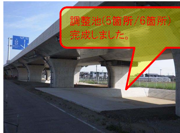
起点側より終点を望む