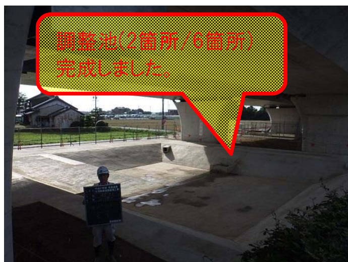
起点より終点を望む