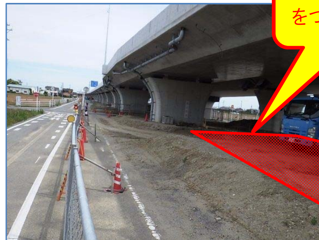
起点より終点を望む