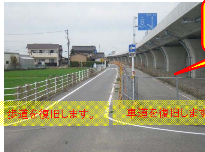
起点より終点を望む

本工事は、豊橋から安城までの5地区で施工を行う工事です。他地区に於いては、2月から工事を着手しております。藤井地区は、4月中旬より準備を進めております。主に高架下に調整池をつくり、側道と歩道の復旧を行います。皆様には、大変ご迷惑をお掛けしますが、ご理解・ご協力をお願い致します。