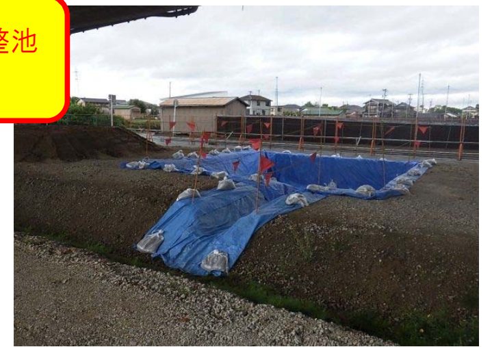
汚濁水防止対策(沈砂池)