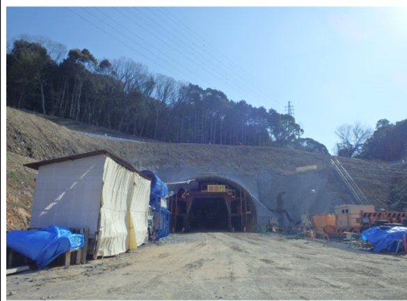
名古屋側より豊橋側を望む