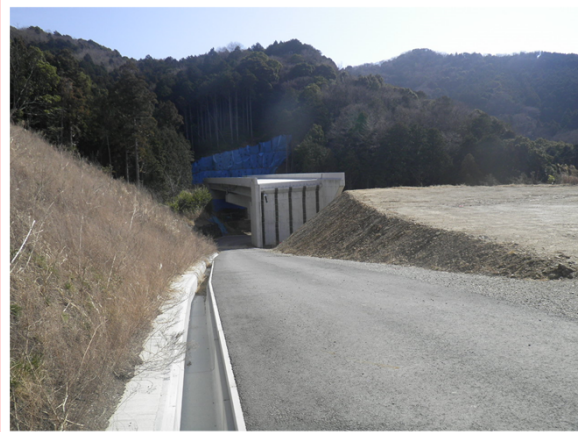
名古屋側より豊橋側を望む