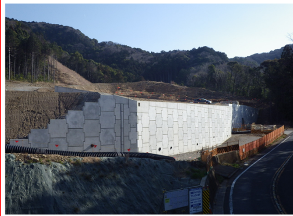
名古屋側より豊橋側を望む